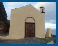
Ermita San Pedro